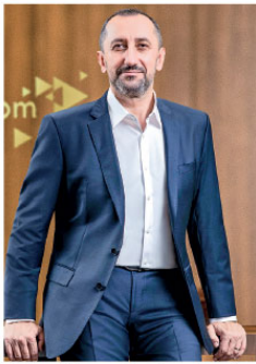
Ümit ÖNAL CEO

Uzaktan eğitim ve evden çalışma düzenine geçişle birlikte sabit internete olan talep artışının da etkisiyle toplam abone sayısının halka arzdan bu yana en yüksek artış değeri olan yıllık yüzde 5,4 artışla 50,4 milyona ulaştığını bildiren Önal, konuşmasını şöyle sürdürdü: "Sabit genişbantta, 2008'deki halka arzdan bu yana hem 4. çeyrekte hem de yıllık bazda en yüksek net abone artışına imza attık. 2020'de bir önceki yıla göre yüzde 18 artışla sabit genişbant abone sayımız 13,4 milyona ulaştı. İlki Nisan 2020'de, ikincisi Eylül 2020'de olmak üzere, Türk Telekom tarihinin sabit internet aylık satış rekorunu üst üste iki kez kırdık. 2020'de genişbant gelirlerimiz yüzde 25 arttı. Bu, halka arzdan bu yana en yüksek büyüme. Geçen yılın 4. çeyreğinde bu fiyala yüzde 32 oldu. Sabit genişbant ARPU, fiyatlaması ve karma etkisi arasındaki doğru dengeyi bulma çabalarımız-