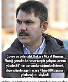
Çevre ve Şehircilik Bakanı Murat Kurum, Elazığ genelinde hasar tespit çalışmalarının yüzde 85'ini tamamlanmış olduğunu belirterek, il genelinde ağır hasarlı 4 bin 600 binanın yıkılacağını söyledi.

Çevre ve Şehircilik Bakanı Murat Kurum, Mustafa Paşa Mahallesi'nde drone ile yapılan çekimler ve lazer tarayıcılarla gerçekleştirilen çalışmaları ilgili incelemelerde bulundu. İle yürütülen çalışmalarda gelinen aşamaya ilişkin gazetecilere açıklama yapan Kurum, bugün itibarıyla Elazığ'daki hasar tespit çalışmalarında 150 yıkık, 4 bin 552 ağır, 1779 orta hasarlı bina tespit edildiğini bildirdi. Kurum, "Yaklaşık 40 bin binanın tespiti yapıldı. Elazığ genelinde hasar tespit çalışmalarının yüzde 85'ini tamamlamış bulunmaktayız. İnşallah yarın itibarıyla hasar tespit büyük bölümünü tamamlamış olacağız" diye konuştu. Sırcı ve Maden için de merkezilerde hasar tespit çalışmalarının tamamlandığını, köylerinde işe başlanıp devam ettirildiğini anladığını Kurum, il genelinde ağır hasarlı 107 binanın yıkılmı tamamlandığını aktardı.