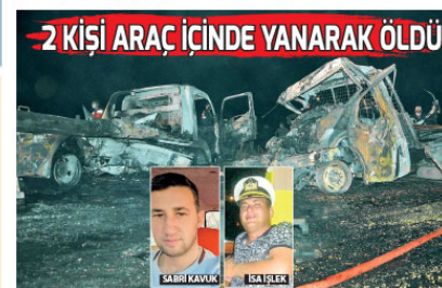
2 Kişi Araç İçinde Yanarak Öldü

Antalya'da çekici ile küçükbaş hayvan yüklü kamyonetin kafa kafaya çarpıştığı kazada benzin deposunun patlaması sonucu yangın çıktı. Kazada kamyonet içinde sıkışan 2 kişi yanarak can verdi.