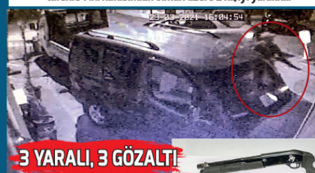
3 YARALI, 3 GÖZALTİ

Kağıthane'de güdültü kavga sonrası bir grubun kebapçı dükkanını basması sonucu çıkan kavgada, iş yeri sahibi pompalı tüfekle 1'ini kafasından olmak üzere 2 kişiyi yaraladı.