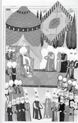
Yavuz Sultan Selim'in çıkış törenini gösteren bir Osmanlı minyatürü

(Bu zorbalarda, mesnetsiz ve kaynaksız bir şekilde padişahın; sözcü