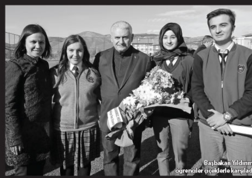
Başbakan Yıldırım'ın ailesiyle birlikte fotoğrafı.

Başbakan Binali Yıldırım, Kemaliye Meydanı'nda düzenlenen "Kemaliye-Dutluca Yolu Temel Atma Töreni"nde halka hitap etti. İcnenin tarihi bir gün yaşadığını, Erzincan'ın, "etrafi dağlık, ortası bağlık bir memleket" olduğunu belirten Yıldırım, "Kemaliye de öyle. Bakın her taraf dağ, ortada şirin bir ilçemiz Kemaliye. Er insanların, can insanların diyarı." ifadesini kullandı.