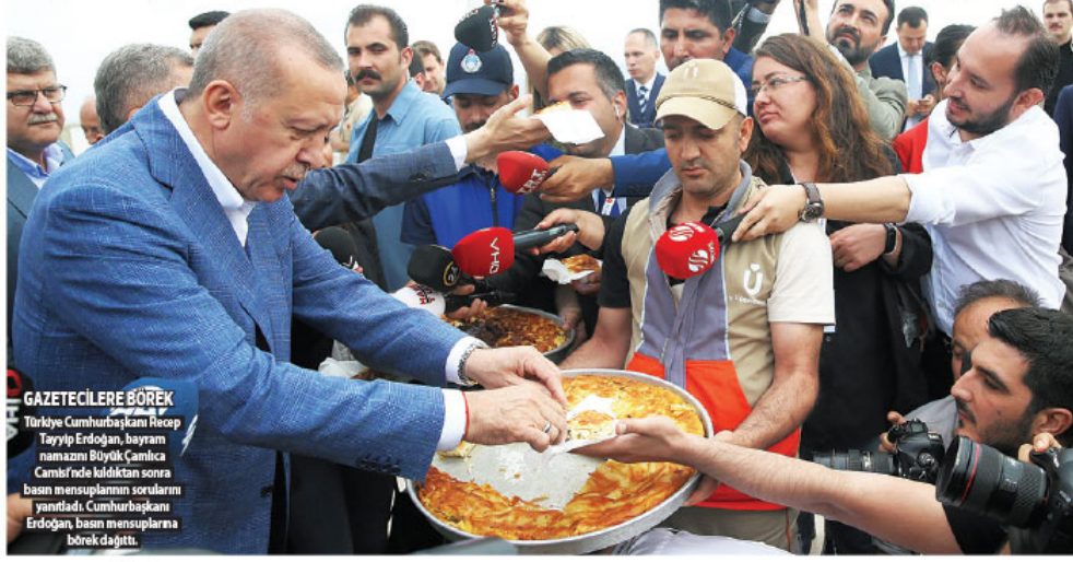
GAZETECİLERE BÖREK Türkiye Cumhurbaşkanı Recep Tayyip Erdoğan, bayram namazını Büyük Çamlica Camii'nde kıldıktan sonra basın mensuplarının sorularını yanıtladı. Cumhurbaşkanı Erdoğan, basın mensuplarına börek dağıttı.

Cumhurbaşkanı Recep Tayyip Erdoğan, S-400'ler konusunda ilgili, "Burada bizim yaptığımız bir anlaşma var, kararlılığımız var. Buradan geri adım atmak gibi bir şey söz konusu değil." dedi.