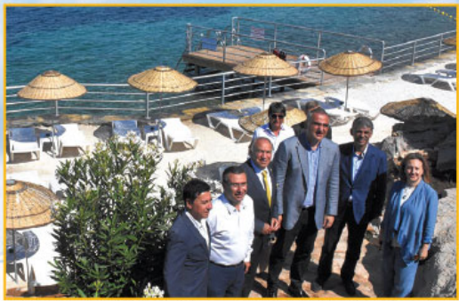
reye alıyoruz. Bodrum ve Çeşme halkına şimdiden hayırlı olsun."

ile yayılmasını planladıklarını da belirtti. Ersoy, vatandaşlara geçen sene halk plajlarıyla ilgili bir söz verdiğini hatırlatarak, şöyle konuştu: "Turizm deyince sadece yabancı turisti düşünmemek lazım. Özellikle turizm bölgelerinde yaşayan yerel halkın da ihtiyaçlarını gözlemliyoruz. Geçen sene Bakanlık olarak bir sözümlüydük. Turizmin yoğun yapıldığı bölgelerde Antalya, Bodrum, Dalaman ya da İzmir olsun yerel halkın da sorunlarını çözecek bazı formlar geliştirmeyi düşüncelerimizde vardı. Bu bağlamda halk plajları projelerini geliştirdik. Bugün Allah'ın izniyle halk plajlarının ilkini Bodrum'da, İkinci'sini de Çeşme'de hizmete açıyoruz. 400'er kişilik halk plajları bu sene deneme mahiyetinde ilk kez açılacak. İnşallah bundan sonra da her yıl 4-5 tane bunlara ilave ederek ihtiyaç duyulan bölgelerde yerel halka yönelik, bölgedeki emsallerine karşı çok daha makul fiyatlarla hizmet verecek halk plajlarını dev-