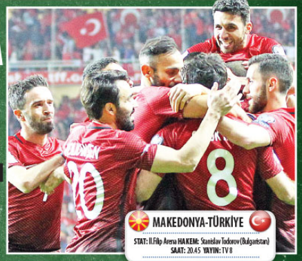
MAKEDONYA-TÜRKİYE STAT: İl Filp Arena HAKEM: Stanislav Todorov (Bulgistan) SAAT: 20.45 YAYIN: TV 8

Uluslararası Futbol Federasyonları Birliği (FIFA) dünya sıralamasında Türkiye, Makedonya'nın oldukça üstünde bulunuyor. FIFA'nın haziran ayı değerlendirmesine göre, Türkiye, 855 puanla 25. basamakta yer bulurken, 218 puanlı Makedonya 136. sırada yer aldı.