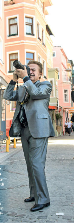
FOTO SAFARI UNESCO'NUN 17 KÜLTÜREL MİRASINI KAPSAYACAK