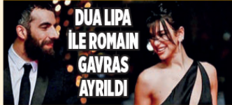
DUA LIPA İLE ROMAIN GAVRAS AYRILDI

main Gavras, ilk kez Paris Moda Haftası'nda sahne arkasında birbirlerini öperken yakalandı, haklarında aşk dedikoduları çıkmıştı. Ardından Mayıs ayında Cannes Film Festivali'ni kırımlı halindedir el ele yürüyen çift, aşklarını ilan etmişti.