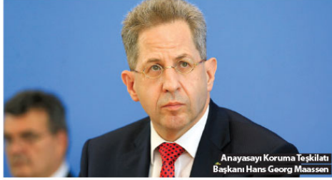
Anayasayı Koruma Teşkilatı Başkanı Hans-Georg Maassen

Sol Parti ve Yeşiller de, iddiaların araştırılması için istihbarat servisleri-