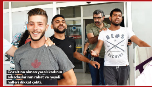
Gözaltına alınan yaralı kadının arkadaşlarının rahat ve neşeli halleri dikkat çekti.

Samsun'un Canik İlçesinde dere kenarında oturan bir kadın av tüfeğiyle vurularak yaralandı.