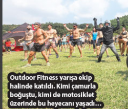
Outdoor Fitness yarışa ekip halinde katıldı. Kimi çamurla boğuştu, kimi de motosiklet üzerinde bu heyecanı yaşadı...