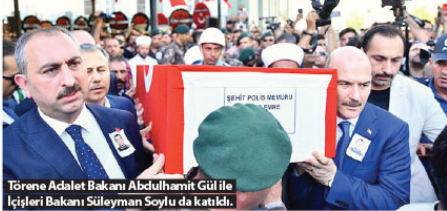
Törene Adalet Bakanı Abdulhamit Gül ile İçişleri Bakanı Süleyman Soylu da katıldı.