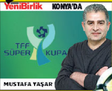
YeniBiriklik KONYA'DA TFF SÜPER LİG KUPASI MUSTAFA YAŞAR

Süper Lig şampiyonu Galatasaray, Türkiye Kupası sahibi Akhisarspor ile Süper Kupa için Konya'da karşı karşıya gelecek.