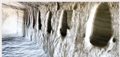
Türkiye'nin önemli turizm merkezlerinden Kapadokya bölgesinde bulunan dünyanın en büyük yer altı şehrinde Roma askerlerinin atlarını bari bulunda bin 500 yıllık ahır ortaya çıktı.

NEVŞEHİR Belediyesi tarafından ortaya çıkarılan dünyanın en büyük yer altı şehrinde çalışmalar devam ediyor. Çalışmalar sırasında bin 500 yıl önce Doğu Roma döneminde savaş atlarının yetiştirildiği ve atların bakımının yapıldığı ahır ortaya çıktı. Ahır içerisinde 50 yıllık bulunurken, yemliklerde 100 atın aynı anda beslendiği ifade edildi.