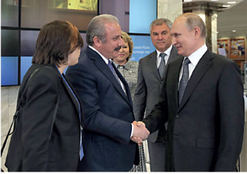
"S-400 konusunda karar verildi. Temmuz ayı içerisinde ilk parti teslimat yapılacak. Olsun mu olmasın mı, alalım mı almayalım mı noktasında değiliz" diye konuştu.

Moskova'daki Türk gazetecilere bir araya gelen Şentop, Türkiye'nin Rusya'dan satın aldığı S-400 hava savunma sistemlerine ilişkin değerlendirmelerde bulundu. Şentop, Cumhurbaşkanı Recep Tayyip Erdoğan'ın Rusya'dan S-400'ün satın alınacağına dair açıklamasını hatırlatarak,