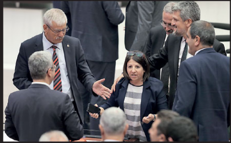
"S-400 konusunda karar verildi. Temmuz ayı içerisinde ilk parti teslimat yapılacak. Olsun mu olmasın mı, alalım mı almayalım mı noktasında değiliz" diye konuştu.

Ağralıoğlu, Cumhurbaşkanı Recep Tayyip Erdoğan'ın Sincar'da yaşanan Türkiye'deki illi "mutlu ve huzurlular" cümlesini doğru bulmadığını söyledi. HDP Grup Başkanvekili Fatma Kurtulan, İYİ Parti'nin, MHP'den oy devşirmeye dönük bir tutum içinde olduğunu ifade etti. "Kürt sorunu gibi önemli bir sorunu böyle terzile, kriminalize eden, HDP'yi farklı şekilde itham eden tutumlarınızdan vazgeçin." diyen Kurtulan, "İYİ Parti, size söylüyorum: Size rağmen, içinde bulunduğunuz ittifakta, HDP ve PKK'ya içinde gönül vermişlerin de olduğu insanlar oy verdi. Şu an koltuklarınızda HDP'nin oylarıyla oturuyorsunuz. Bu ittifakta, CHP'yle yaptığımız ittifakta HDP'nin oylarının etkisi vardır. Ne yapacak-