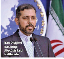
İran Dışişleri Bakanlığı Sözcüsü Said Hatibzade