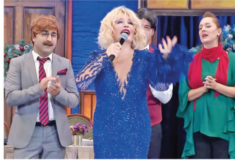
han konseri gecenin en güzel renklerinden biriydi.