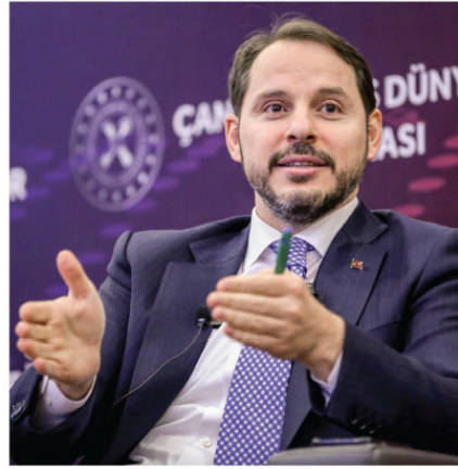
Hazine ve Maliye Bakanı Berat Albayrak, geçen yıl için beklentilerin yüzde 12'nin altında enflasyon hedefinin yakalandığını, 2020'de de enflasyonla mücadelenin ana gündemlerimizden biri olacağını belirtti.

Albayrak, Twitter hesabından yaptığı açıklamada, 2019 yılı enflasyon ve ihracat rakamlarını değerlendirdi. Enflasyonda 2019'u hedeflediklerini yüzde 12'nin altında kapattıklarını vurgulayan Albayrak, "2020'de de enflasyonla mücadele ana gündemlerimizden biri olacak. İnşallah, ürün ve hizmet piyasalarında rekabeti daha da iyileştirecek,