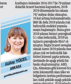
Gülşay YÜCEL ANKARA

2019 yılına ilişkin küresel verilerle ilgili detaylı ve Türkiye ekonomisindeki dış ticaret verilerini paylaştığını Pekcan, geçen yıl yapılan çalışmalar ve 2020 hedefleri hakkında da bilgi verdi. Pekcan, Türkiye'nin 2019 yılı ihracatında yüzde 2,04 oranında büyümeye göstererek 180 milyar 468 milyon dolara yükseldiğini açıkladı. Dünyadaki kanışıklıklar sebebiyle uluslararası ticaret alanında olumsuz bir havanın hakim olduğuna değinen Pekcan, Türkiye'nin bu şartlar altında dahi büyümeye gösterdiği beklenti. Bakan Pekcan, "Türkiye ekonomisi, zorlu küresel şartlara rağmen 2018 senesinde yaşanan küreleştirmeye rağmen bir dengelenme sürecine, arkasından da büyüme patikasına girmiş bulunmaktadır. Bu olumlu gelişmelerde dış ticaretimizin pozitif katkı sağladığını görüyoruz. 2019 yılında küresel ticaret savaşlarıyla birlikte Brexit sürecindeki belirsizlikler, bölgeleştirmeye yönelik, sıcak çatışmalar, Suriye, Irak, Libya, Venezuela'ya uygulanan ambargolar, Fransa, Hong Kong ve Latin Amerika'daki kanışıklıklar mülkela küresel talebin azalmasında, küresel ticaretin azalmasında etkili olmuştur. Küresel ekonomide ithalata