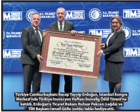
Türkiye Cumhurbaşkanı Recep Tayyip Erdoğan, İstanbul Kongre Merkezi'nde Türkiye İnovasyon Haftası İnovatif Ödül Töreni'ne katıldı. Erdoğan'a Ticaret Bakanı Ruhsar Pekcan (sağda) ve TİM Başkanı İsmail Gülle (solda) tablo hediye etti.

Pekcan, bugün finans ve enerji sektörleri hariç tutulduğunda dünyanın en karlı 20 şirketten 16 tanesinin inovasyon şirketleri