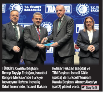
TÜRKİYE Cumhurbaşkanı Recep Tayyip Erdoğan, İstanbul Kongre Merkezi'nde Türkiye İnovasyon Haftası İnovatif Kurulu Başkanı Ahmet Akça'ya Ödül Töreni'nde, Ticaret Bakanı Ruhsar Pekcan (sağda) ve TİM Başkanı İsmail Güllü (solda) ile Turkecell Yönetim Kurulu Başkanı Ahmet Akça'ya (sol 2) plaket verdi. Sayfa 8

İÇİŞLERİ Bakanlığı, Bolu Belediyesi'nde Suriyelilere yapılan yardım kesilmesi ile ilgili Belediye Başkanı Tanju Özcan hakkında soruşturma başlattı. Sayfa 9