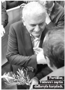
Partiler, Yıldırım'ı ziyarette karşıladılar.