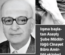
İşima başlatılan Asayiş Şube Müdürlüğü Cinayet Büro Amirliği ekipleri,

binaya çevresindeki güvenlik kamerası görüntülerini inceledi. Olay günü, saat 12.00 sularında Demirci çiftinin kaldığı adresten çıkan şüpheli 3 kişi tespit edildi. Başlarına taktıkları kapüşonla, yüzlerini kameralardan saklamaya çalışan şüphellilerin ellerindeki çantaları bir araca bindikleri belirlendi.