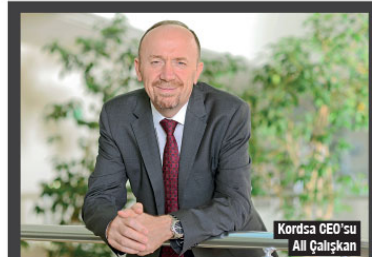
Kordsa CEO'su Ali Çalişkan

Emra & Erver Yücel (SEY) Vakfı, İzmir'deki depremden enkaz altından kurtarılan tüm çocukları, hayat boyu eğitim masraflarını karşılayacağı açıkladı. Vakıf, enkazdan çıkan ve çıkması beklenen bütün çocuklar için yaptığı açıklamayı sosyal medya hesaplarından, "İzmir'deki deprem hepimizi derinden sarstı. Ama biliyoruz ki ateş en çok düştüğü yeri yakıyor. Şimdi, küçükük yaşta çocuklarımızın ruhumdaki büyük yaraları, bir nebze olsun iyileştirme zamanı. Enkazdan çıkıp mucize yaratan ve enkazdan çıkma umudunu bir an olsun yitmeden beklediğimiz tüm çocuklarımızın, hayatın boyunca tüm eğitim masraflarını SEY Vakfı olarak karşılamak üzere yola çıktığımızı bildirmek istiyoruz" sözleriyle duyurdu.