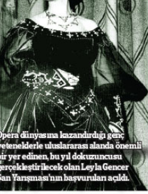
Opera dünyasına kazandırdığı genç yeteneklerle uluslararası alanda önemli bir yere edinen, bu yıl düzenlenen 9. Gencer Şan Yarışması'nın başyürürlüğüne açıldı.

derilen video kayıtları ile değerlendirilme de eklenecek. Ayrıca tüm başvurular internet platformu Yap Tracker üzerinden alınacak ve başvuru ücreti için banka havesinin yanı sıra kredi kartı ile ödeme de kabul edilecek. Yarışmanın ön elemeleri, 26-27 Nisan 2018'de Milan'da, 5-6 Mayıs 2018'de İstanbul'da gerçekleştirilecek. Adaylar yarışma canlı ön elemeler katılımcılarına internet üzerinden yükleyerek de ön elemeye katılmayı seçebilecekler. Ön elemeye sonucunda yarışmanın sitesinden 10 Mayıs 2018 tarihinde açıklanacak. E-posta yoluyla da bildirim alacak olan yarışmacıların final serisi 23-28 Eylül tarihlerinde İstanbul'da gerçekleştirilecek.