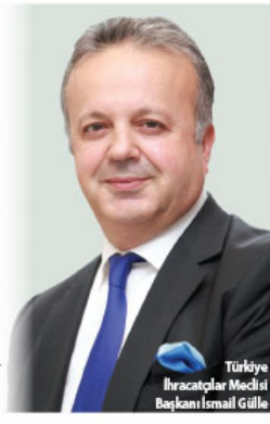
Türkiye İhracatçıları Meclisi Başkanı İsmail Gülle

Mayıs ayı ihracat rakamlarını değerlendiren Türkiye İhracatçıları Meclisi (TİM) Başkanı İsmail Gülle, "Geride bıraktığımız Mayıs ayı, hem aylık hem de günlük bazda Cumhuriyet tarihi ihracat rekorlarını kırdığımız bir ay oldu. Mithbarek Ramazan ayının bereketinin ihracatımıza yansadığını hep birlikte görüyoruz. İhracatçılarımız için Ramazan Bayramı, çifte bayrama dönüştü. Ayrıca, hem genel ticaret sistemi, hem de özel ticaret sistemine göre tüm zamanların en yüksek aylık ihracat rakamına Mayıs ayında ulaştık" dedi.