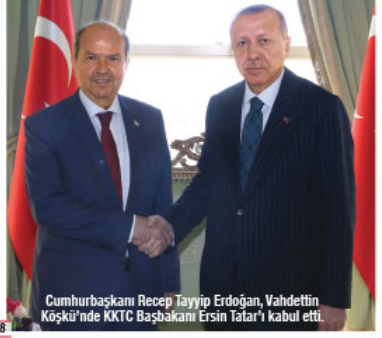
Cumhurbaşkanı Recep Tayyip Erdoğan, Vahdettin Köşkü'nde KKTC Başbakanı Ersin Tatar'ı kabul etti.

Kuzey Kıbrıs Türk Cumhuriyeti (KKTC) Başbakanı Ersin Tatar, Türkiye Cumhurbaşkanı Recep Tayyip Erdoğan ile "yararlı ve olumlu" bir görüşme yaptıklarını belirtti. Tatar, "Kabul sırasında ekonomik sorunlarımız, Kıbrıs konusundaki son durum ve Doğu Akdeniz'deki hidrokarbon yatakları üzerinde durduk. Yararlı ve olumlu bir görüşme oldu. Temaslarımız devam edecektir." ifadelerini kullandı. 8