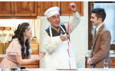
'Zengin Mutfak' oyununun bir sahnesi. Arka plan, İstanbul'da çekildi.