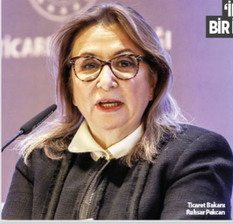
Ticaret Bakanı Ruhsar Pekcan

Bu yıl dış ticaret açığındaki hızlı düşüşün ekonomideki finansman ihtiyacını azaltarak ekonomiyi stratejik bir katkı sunduğuna işaret eden Pekcan, "Yılın ilk 5 ayında dış ticaret açığımızda daralma 25,5 milyar dolar seviyesinde gerçekleşti. Diğer bir ifadeyle ülke ekonomimizin geçen yılın aynı dönemine göre dış finansman ihtiyacı 25,5 milyar dolar azalmıştır" dedi.