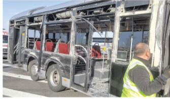
İstanbul'da metrobüs kazası

Hatay Valiliğinden yapılan açıklamada da minibüste yasa dışı göçmen taşıdığı belirtilirken, araçta bulunan tüm kişilerin kimlik ve uyruklarını belirleme çalışmalarının sürdüğü aktarıldı.