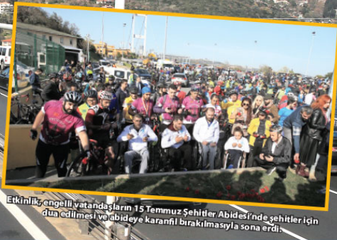
Etkinlik, engelli vatandaşların 15 Temmuz Şehitler Abidesi'nde şehitler için dua edilmesi ve abideye karanfil bırakılmasıyla sona erdi.