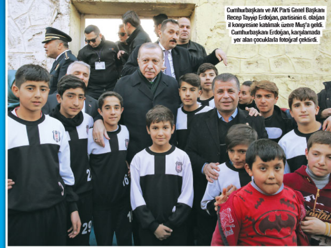
Cumhurbaşkanı ve AK Parti Genel Başkanı Recep Tayyip Erdoğan, partisinin 6. olağan il kongresine katılmak üzere Muş'a geldi. Cumhurbaşkanı Erdoğan, karşılamada yer alan çocuklarla fotoğraf çekti.

Cumhurbaşkanı Recep Tayyip Erdoğan: Bazı iş adamlarının varlıklarını yurt dışına kaçırma gibi gayretlerinin olduğunu duyuyorum. Buradan sesleniyorum, önce kabineye sesleniyorum, bunların hiçbirine çıkış için asla izin vermemelisiniz. Çünkü bu adımlar ihanet-i vataniye'dir