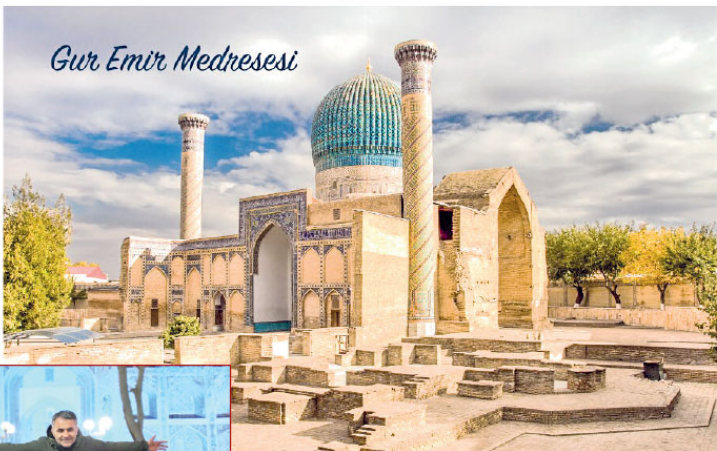
Gur Emir Medresesi

Bugün külliyeyi gezdiğimizde Timur'un kabrinin başında hocası Said Bereke'nin mezarını, diğer tarafta ise oğulları ve torunlarının mezarlarını görüyoruz. Külliye'de bulunan mezarların taşları ayet ve vezirlerle süslendirilmiştir. Külliye'nin dış yüzünde işlemler ve mozaiklar İran'dan Semerkant'a getirilen ustalarca inşa edilmiştir. Külliye'nin oluşturulan yapıların cephelelerinde ayet ve hadisler yer almaktadır.