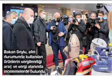
Bakan Soylu, afet durumunda kullanılan ürünlerin sergilendiği araç ve sergi alanında incelemelerde bulundu.