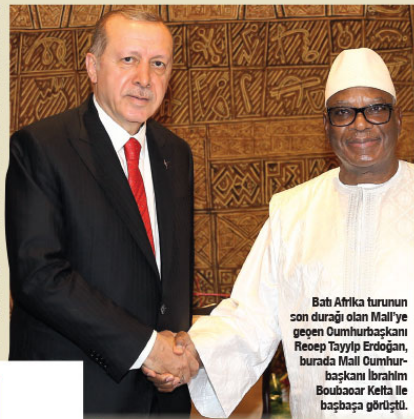
Batı Afrika turunun son durağı olan Mali'ye geçen Cumhurbaşkanı Recep Tayyip Erdoğan, burada Mali Cumhurbaşkanı Ibrahim Boubacar Keita ile başbaşa görüştü.

Cumhurbaşkanı Recep Tayyip Erdoğan: Mehmetçüğümüz ve Özgür Suriye olmak üzere yaklaşık 120 civarında şehidimiz var. Yaklaşık son aldığım haberle de 2348 teröristi etkisiz hale getirdik. Bitün teröristleri bölgeden temizleyene kadar bu mücadeleyi sürdüreceğiz.