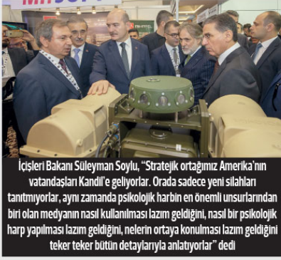
İçişleri Bakanı Süleyman Soylu, "Stratejik ortağımız Amerika'nın vatandaşları Kandil'e gelyorlar. Orada sadece yeni silahları taniyorlar, aynı zamanda psikolojik harbin en önemli unsurlarından biri olan medyanın nasıl kullanılması lazım geldiğini, nasıl bir psikolojik harp yapılması lazım geldiğini, nelerin ortaya konulması lazım geldiğini teker teker bütün detaylarıyla anlatıyorlar" dedi

"Güvenlik tanımları, güvenlik sorunları ve ihtiyaçları neredeyse yeniden yazıldı, yazılmaya devam ediyor. Ülkeler arası savaş, yerli vekâletler savaşına bürküldü. Bazı devletler istihbarat servisleri eliyle hem de kaçtan terör örgütlerini besliyor, silah ve para gönderiyor, hattâ eğitimler gönderiyor. Zannedilmeyen ki sadece yeni teknoloji silahları kullanmak için eğitimler gönderiyor. Stratejik ortakımız Amerika'nın vatandaşları Kandil'e gelyorlar. Orada sadece yeni silahları taniyorlar, aynı zamanda psikolojik harbin en önemli unsur-