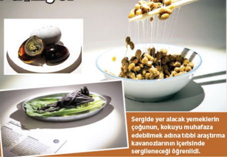
Sergide yer alacak yemeklerin çoğunun, kokuyu muhafaza edebilmek adına tıbbi araştırma kavanozlarında içerisinde sergilenileceği öğrenildi.