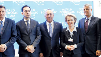
Dişşleri Bakanı Mevlüt Çavuşoğlu (ortada), İsviçre'nin Cenevre kentinde düzenlenen WEF'in Batı Bakanlar Stratejik Diyaloğ Liderler Toplantısı'na katıldı. Toplantı öncesinde aile fotoğrafı çekildi.

çalışmaları önemliydi" açıklamasında bulundu. Çavuşoğlu, "Artık Münbiç'ten YPG'ilerin tamamen çıkarılması ve Münbiç'i yerel insanlara bırakılması, yönetim bakımından da güvenli birimleri bakımından da bırakılmasının zamanı gelmiştir" ifadesini kullandı. Bakan Çavuşoğlu, söz konusu mutabakatın ABD ile harfi harfine uygulanması gerektiğini altını çizerek, "Onlardan kaynaklanan bir gecikme oldu ama tamamen köti işçiyi ya da hiç işlemiyor diyemeyiz" diye konuştu.