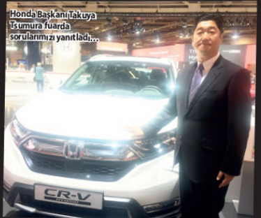
Honda Başkanı Takuya Igumura fuarda sorularımıza yanıtladı...

2018 yılındaki üçlemesinin son adımı olan premium bir robot otomobil konseptinin dünya primiyerini gerçekleştirdi. Renault, Alpine ve Dacia, Paris Otomobil Fuarı'nda ziyaretçilerini ağırlıyor Renault, mobilite alanında