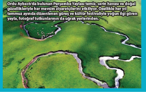
Ordu Aybastı’da bulunan Perşembe Yaylası temiz, serin havası ve doğal güzellikleriyle her mevsim ziyaretçilerini etkiliyor. Özellikle her yıl temmuz ayında düzenlenen güreş ve kültür festivaliyle yoğun ilgi gören yayla, fotoğraf tutkularının da uğrak yerlerinden.