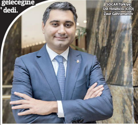
SOCAR Türkiye Üst Yöneticisi (CEO) Zaur Gahramanov

"Türkiye gibi açık pazarlarda şirketler birleşir veya kapanır, bu normal bir süreç. Bu bir şans zamanı. İyi şirketler iyi para alıyor, satılabilir. Devlet de doğrudan bir politika tutturdu ve burada ilave borçlanma yapılmasını isteyerek şirketlere ortak alın" dedi. Kendi adına konuşmak gerekirse bir iş adamı olsaydı ve param olsaydı, kesinlikle bu ortaklıklara girerdim. Çok iyi şirketler ve ortaklık arayışları da var.