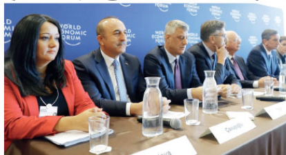
Dişşleri Bakanı Mevlüt Çavuşoğlu (sol 2), İsviçre'nin Cenevre kentinde düzenlenen WEF'in Batı Bakanlar Stratejik Diyaloğ Liderler Toplantısı soruştaki düzenlenen ortak basın toplantısına katıldı.

Dişşleri Bakanı Çavuşoğlu, "Artık Münbiç'ten YPG'ilerin tamamen çıkarılması ve yerel halka bırakılmasının zamanı gelmiştir" dedi. Dişşleri Bakanı Mevlüt Çavuşoğlu, İsviçre'deki temasları kapsamında gündeme ilişkin değerlendirmelerde bulundu. Türk Silahlı Kuvvetleri ve ABD unsurlarının Münbiç'teki ortak devriye görevine ilişkin Çavuşoğlu, "Takvimde biraz gecikme var ama şu ana kadar Münbiç bölgesinde aynı yapıldığımız tatbikatlar ve kol kuvvetlerinin orada yaptığı