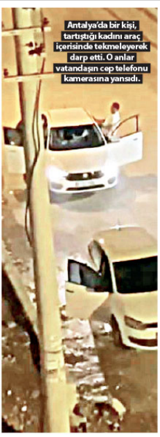
Antalya'da bir kişi, tartıştığı kadını araç içerisinde tekmeleyerek dışarı attı. O anları vatandaşın cep telefonu kamerasına yansıdı.

Sosyal medyada paylaşılan ve birçok kullanıcının tepkisine neden olan, önceki gece saatlerinde Kepez ilçesi Ünsal Mahallesi'nde meydana geldi. Görgü tanıklarının ifadesine göre park halindeki otomobil içerisinde bir kadınla erkekğin tartışmasını gören başka bir sürücü, durarak onları ayırmaya çalıştı. Bu sırada çevredeki vatandaş da olan biteni çekmek için cep telefonuyla kayda girdi. Kadının oturduğu ön koltuğa doğru yönelen erkek şahıs, 2 kişi ayırmaya çalıştı. Odukları korktuğu gözlenen kadın sakinleştirilmeye çalışılırken, erkek şahıs şoför kapısına doğru yönelip elleriyle arabaya tutunarak kadının yüzüne sert bir tekme atı. Tekme sonrası araç içerisinde "lütfen" sesleri yankılanırken, çevredekiler durumu polise bildirdi.