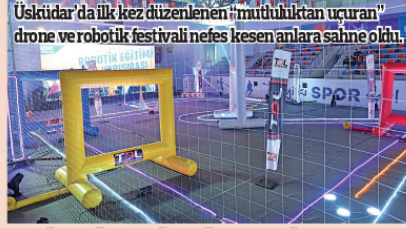
Üsküdar'da ilk kez düzenlenen "mutluluktan uçuran" drone ve robotik festivali nefes kesen anlara sahne oldu.

Venus Z40 ayrıca 6.4 inç Gorilla Glass 5 kırılmaz cam ve tam Amoled ekranıyla telefonu büyütmeye derdi olmadan sınırsız ekran keyfi sunuyor. NFC, kablosuz şarj özellikleriyle ve ekrana gömülü parmak izi sensörüyle Z40, günlük hayatı kolaylaştırıyor. Venus Z40 Aralık ayında lansmana özel 3.149 TL fiyatıyla satışa sunuluyor.