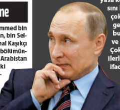
Rusya Devlet Başkanı Vladimir Putin, Suriye'deki durumu çözmeye yönelik Cumhurbaşkanı Recep Tayyip Erdoğan ile diyalog için her türlü imkanı kullandıklarını söyledi. Putin, Arjantin'in başkenti Buenos Aires'te G-20 Liderler Zirvesi sonrasında düzenlenen basın toplantısında Rus gazetecilerin gündeme ilişkin sorularını cevaplandırdı. Cumhurbaşkanı Recep Tayyip Erdoğan ile sıkı görüşme-sinin nedenyle ilgili bir soru üzerine Putin, “Suri-ye'deki durumun çözümü için dahil, görüşmek ve konuşmak için her türlü imkanı kullanıyoruz. Ana-yasa komitesinin oluşturulması konusunda da çalışıyoruz. Çalışma çok hassas ve büyük sabır gerektiriyor. Gerçekten bunu hayata geçiriyoruz ve bunu gerçekleştiriyoruz. Çok dikkatli ilerliyoruz.” ifadelerini kullandı. Su-

Suudi Arabistan Vellaht Prensi Muhammed bin Selman ile görüşüğünü belirten Putin, bin Sel-man'ın Türkiye'de öldürülen gazeteci Cemal Kaşıkç-ı ile ilgili olarak zaten G-20 Zirvesi'nin ilk bölümün-de açıklama yaptığını hatırlattı. Suudi Arabistan ile Rusya'nın petrol üretimi konusundaki anlaşmasını da değerlendiren Putin, “An-laşmayı uzatmak için bir anlaşmamız var. Hacimleri hakkında son bir karar yok. Fakat bunu Suudi Arabistan ile birlikte yapacağız” dedi.