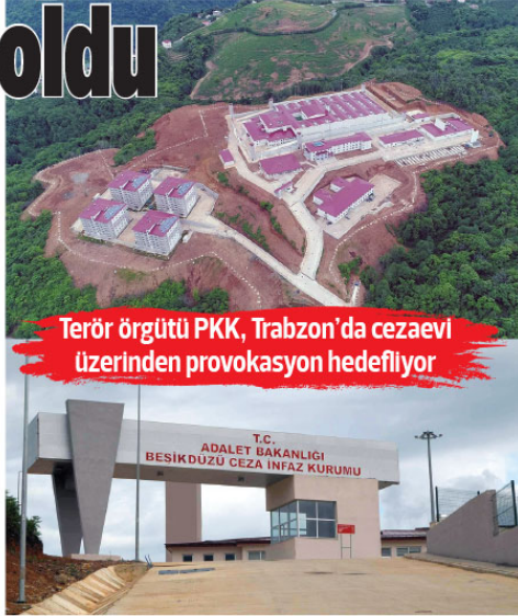
Terör örgütü PKK, Trabzon'da cezaevi üzerinden provokasyon hedefliyor

PKK Silahlı Terör Örgütü'nün, Trabzon üzerinden gerçekleştirilmediği planladığı provokasyon için, medya organları-nın yanı sıra sosyal medyayı da etkin kullanmaya çalıştığı ve propagandasını daha geniş kitlelere yayabilmek adına Fetullahçı Terör Örgütü/Paralel Devlet Yapılanması (FETÖ/PDY) Silahlı Terör Örgütü üyesi kişiler tarafından yönetilen sahte kullanımlar adına açılmış hesap-lardan destek aldığı da saptandı. PKK ve FETÖ/PDY'nin, devletin itibarını sarsma-yı, yargı makamlarını yıpratmayı ve halkı provoke ederek örgütün üzerindeki baskıyı kırmaya yönelik işbirliği içeris-inde hareket ettiği aktarıldı.