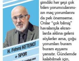
H. Fahmi KETENCI SPOR YeniBirik.com.tr

Beşiktaş deplasmanında oynadığı Çaykur Rizespor ve Antalyaspor maçlarını ise bol gollü galibiyetleri kazandı. Antalyaspor'u 6-2 ile geçen Beşiktaş, Çaykur Rizespor'u 7-2 yendi.