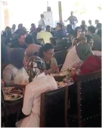
SON KAHALTI İşçilerin kazadan kısa süre önce bir denetim tesisinde kahalvaltı yapan görüntüleri yürek burktu.

1 Mayıs Emek ve Dayanışma Günü kutlamalarına katılmak üzere Kahramanmaraş'ın Elbistan ilçesinden Şanlıurfa'ya giden işçileri taşıyan midibüsün devrilmesi sonucu ilk belirlemelere göre 5 kişi hayatını kaybetti, 13 kişi yaralandı