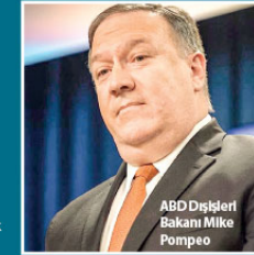
ABD Dışişleri Bakanı Mike Pompeo

kullanma seçeneğinin mevcut olduğunu konusunda oldukça açık ve tutarlı. Umuyoruz ki böyle birşey olmaz. Umarız ki Maduro'nun şiddete başvurmadan ayrılacağı barışçıl bir çözüm olur. Şiddete başvuranları ızzoruz ve onları sorumlu tutacağız. Başkan (Trump), Venezuela demokrasisinin yenileceği konusunda çok net açıklama yaptı."