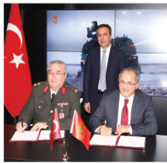
Siber Güvenlik Kümelemesi ile ULAK Haberleşme AŞ arasında MİLAT Yazılım Tabanlı Ağ Yönetim ve Analiz Sistemi'ne

(MAYA) Çözümlerinin Ortak Altyapı Platformu Olarak Kullanılmasına İlişkin İş Birliği Anlaşması imzalandı.