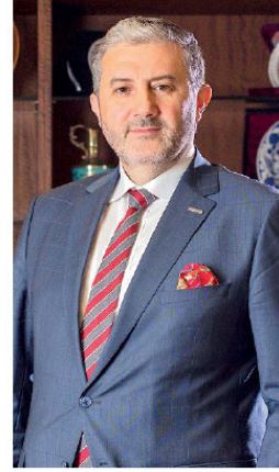
'SALGININ GÖLGESİNDE YÜZDE 1,8'LİK BÜYÜME

Söz konusu paket kapsamında kredi vadesi boyunca istihdamın korunması veya arttırılan işletmelere kredi vadesi dışında teşvik uygulanacağını da aktaran Üstümsal, "Kredi vadesi boyunca istihdam sayılarını koruma veya arttırma taahhüt eden firmalarımıza, 60 ay vadeye kadar aynı faiz oranlarıyla kullandırım yapacağız. Böylelikle istihdamın korunması ve artırılması konusunda da hedefimize ulaşmayı amaçlıyoruz" değerlendirmesinde bulundu.