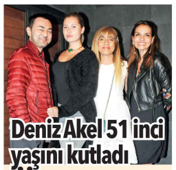
Deniz Akel 51 inci yaşını kutladı

U nü yönetmen Deniz Akel, 51. yaş gününü kardeşi Ebru Akel, Serdar Ortaç ve eşi Chloe ile birlikte Ulus Sunset'te yenen akşam yemeğinde kutladı. Çıkışta gazetecilerin sorularını yanıtlayan Akel, "Bugün 20 inci yaşımı kutladık. Serdar benim canım kardeşim, Ebru'da beni yalnız bırakmadılar. Onları kocaman öpüyorum" diyerek oradan ayrıldı.