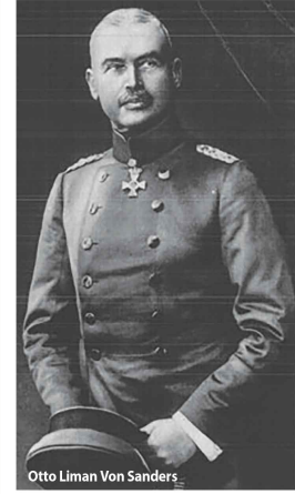
Otto Liman Von Sanders

Almanlar oylayacak metinde göya kendilerini de dokundurmuşlar. Almanların da günahı vardır demişler. Günahları ise bizi engellemekmiş. İyi mi?