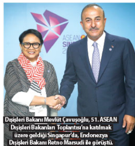
Dişisleri Bakanı Mevlüt Çavuşoğlu, 51. ASEAN Dişisleri Bakanlar Toplantısı'na katılmak üzere geldiği Singapur'da, Endonezya Dişisleri Bakanı Retno Marsudi ile görüşüyor.

Bakan Çavuşoğlu'nun Vietnam Başbakan Yardımcısı ve Dişisleri Bakanı Phan Binh Minh ile yapacağı görüşme ise