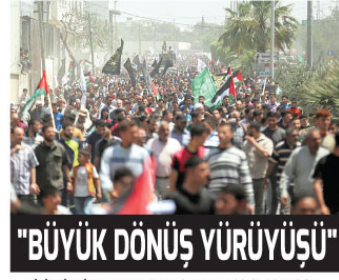
"BÜYÜK DÖNÜŞ YÜRÜYÜŞÜ"

Komite ayrıca, gösterilerin "başçıl" niteliği hakkında da bir rapor hazırladı.