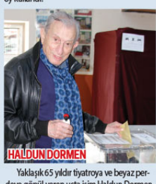
HALDUN DORMEN Yaklaşık 65 yıldır tiyatroya ve beyaz perdeye gönül veren usta isim Haldun Dormen, oyunu kullanmak için gelenler arasındaydı. 91 yaşındaki Dormen asistanının koluna girecek yürürken okul içerisindeki birçok vatandaş ve görevli kendisini alkış yağmuruna tuttu ve sanatçı ile fotoğraf çekilebilmek için sıraya girdi.