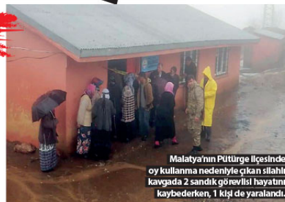
Malatya'nın Pütürge İlçesinde oy kullanma nedeniyle çıkan silahlı kavgada 2 sandık görevlisi hayatını kaybederken, 1 kişi de yaralandı.

1 Mart Mahalli İdareler Genel Seçimleri'nde bazı illerde, sandık başlarında veya okul bahçelerinde bıçak ve tabancaların da kullanıldığı kavgalarda toplam 4 kişi öldü. Sandık başlarında ve okul bahçelerinde kalp krizi geçiren 5 kişi de yaşamını yitirdi. Kavgaların yanı sıra meydana gelen kazalarla birlikte seçim günü toplam 97 kişi de yaralandı.