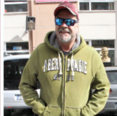
DALGIN SEÇMEN BEYAZ Geçtiğimiz günlerde adres değişikliği yaparak Bebek'ten taşınan Öztürk'ü kullanacağını düşünerek geldiği Bebek Tevfik Filket Okulu'ndan oyunu kullanmadan geri dönmek zorunda kaldı.