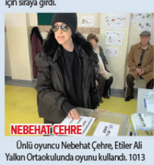
NEBEHAT ÇEHRE Ünlü oyuncu Nebahat Çehre, Etiler Ali Yalın Ortaokulunda oyunu kullandı. 1013 nolu sandığa oyunu kullanan Çehre, "Vatandaşlık görevimizi yaptık, ülkemize hayırlı olur inşallah" dedi.