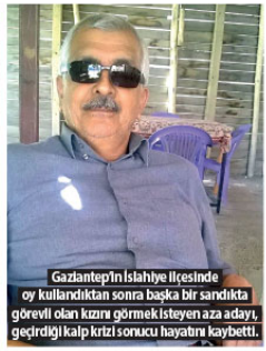
Gaziantep'in İslahiye İlçesinde oy kullandıktan sonra başka bir sandıktaki görevli olan kazın görmek isteyen aza aday, geçirdiği kalp krizi sonucu hayatını kaybetti.

Konya'da sandık başında oy kullanan 3'ü kadın 5 kişi, kalp krizi geçirdi. Görevlilerin ihbarı üzerine olay yerine gelen sağlık ekiplerinin yaptığı kontrollerde kalp krizi geçirdikleri belirlendi.