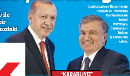
Cumhurbaşkanı Recep Tayyip Erdoğan ve Özbekistan Cumhurbaşkanı Mirziyoyev, Özbekistan - Türkiye İş Forumu'na katıldı.

Cumhurbaşkanı Recep Tayyip Erdoğan, Özbekistan Cumhurbaşkanı Mirziyoyev ile ortak basın toplantısında, "Önümüzde bir hedef var, 5 milyar dolara inşallah aramızdaki ticaret hacmini çıkartacağız" dedi.