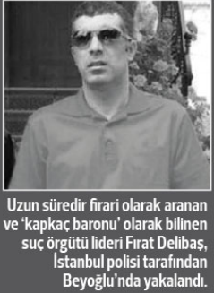
Uzun süredir firari olarak aranan ve 'kapkaç baronu' olarak bilinen suç örgütü lideri Fırat Delibaş, İstanbul polisi tarafından Beyoğlu'nda yakalandı.

Anayasa Mahkemesindeki bireysel başvuruların 168 bin 807'si adli yargılamaya hakkının ihlali gerekçesiyle yapıldı. 35 bin 280 başvuruya mülkiyet hakkının ihlali gerekçesi ikinci sırada yer aldı. Diğer başvurular, kişi hürriyeti ve güvenliği hakkı, özel hayatın gizliliği ve korunması, ayrımcılık yasası, yaşam hakkı ve diğer hakların ihlali gerekçesiyle yapıldı. Karara bağlanan başvuruların yüzde 82'si, yani 118 bin 174'ü kabul edilmez bulunurken, yalnızca yüzde ikisinde, yani 2 bin 629 başvuru hakkında ihlal kararı verildi. Bir başvuruda bir veya birden fazla hakkın ihlal edildiği karar verildiği göz önüne alındığında, kararların yüzde 77'sini adli yargılamaya hakkının ihlali oluşturdu. Bunu, kişi hürriyeti ve güvenliği hakkı, ifade özgürlüğü hakkı, özel hayatın ve aile hayatının korunması hakkının ihlal edildiği kararları izledi.