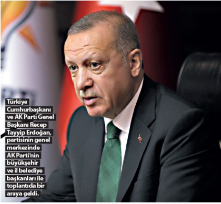
Türkiye Cumhurbaşkanı ve AK Parti Genel Başkanı Recep Tayyip Erdoğan, partisinin genel merkezinde AK Parti'nin Büyükşehir ve İl Belediye Başkanları ile toplantıda bir araya geldi.

"Türkiye'nin bekasının garantisini AK Parti ve Cumhurbaşkanlığı'nın ortaklığıyla sağladığımızı, Biz ne kadar güçlü olursak ülkemiz de o kadar güçlü olacaktır. AK Parti kalesinde ve Cumhurbaşkanlığı bünyesinde gedik açma çabalarının gerisinde bu hakikat vardır."