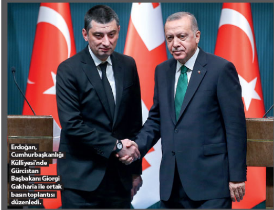
Erdoğan, Cumhurbaşkanlığı Külliyesi'nde Gürcistan Başbakanı Giorgi Gakharia ile ortak basın toplantısı düzenledi.

AK Parti Genel Merkezi'ndeki kabul, basına kapalı gerçekleşti.