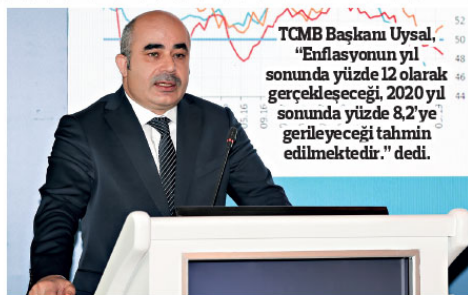
TCMB Başkanı Uysal, "Enflasyonun yıl sonunda yüzde 12 olarak gerçekleşeceğini, 2020 yıl sonunda yüzde 8,2'ye gerileyeceği tahmin edilmektedir." dedi.

Yılın üçüncü çeyreğinde tüketici enflasyonunun Temmuz Enflasyon Raporu tahminlerine göre 1,5 puan aşağıda gerçekleşmesinin ve gelecek dönemde enflasyonun ana eğiliminde beklenen iyileşmenin yıl sonu enflasyon tahmini üzerindeki düşü-