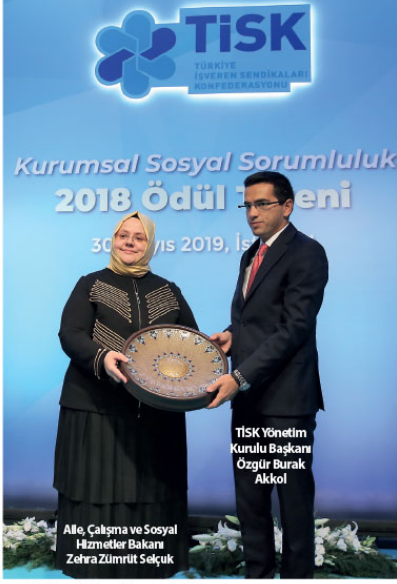
Alie, Çalışma ve Sosyal Hizmetler Bakanı Zehra Zümrüt Selçuk

"Yerel ve ulusal düzeyde ciddi bir biriktirme sahip TİSK'in, yetkili tek işveren temsilcisi kuruluşu olarak bu hizmetleri yürütüyor önemli görevi bir misyonudur. TİSK'in endüstri-